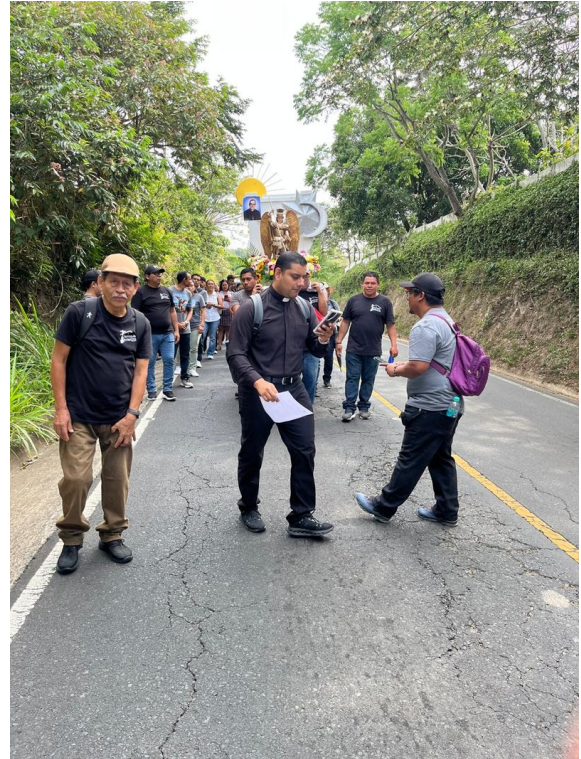
La comunidad unida en oración y fraternidad a lo largo del camino.

Esta peregrinación, enmarcada bajo el lema “Bajo el Escudo de San Miguel Arcángel: Peregrinación de Fe, Protección y Servicio”, representa un importante hito en el fortalecimiento de nuestra comunidad de fe y servicio.