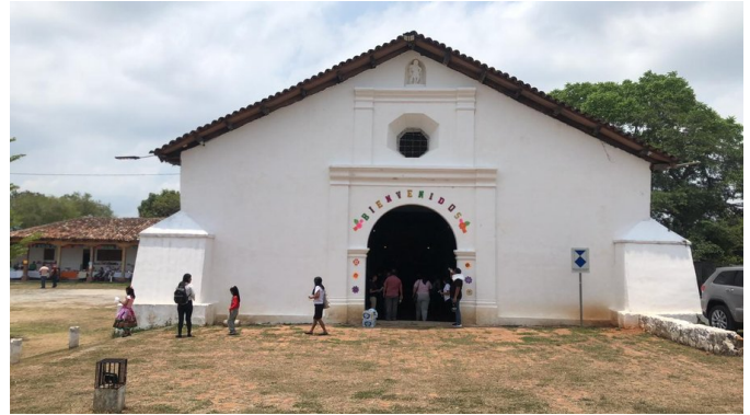
La histórica Parroquia San Miguel Arcángel de Huizúcar recibe a los peregrinos.

Una Iglesia que ha resistido terremotos, tormentas, conflictos y el paso del tiempo.