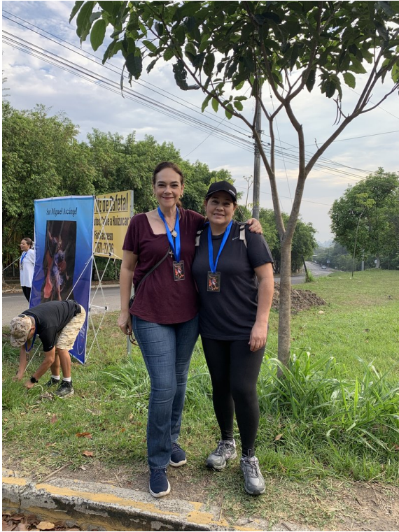
Peregrinos al concluir la jornada de fe.

Al concluir este hermoso día, los peregrinos regresaron a sus hogares con el alma llena de gozo. No solo habían recorrido diez kilómetros físicos, sino que habían caminado espiritualmente junto a Jesucristo, bajo la mirada amorosa de la Santísima Virgen María y protegidos por el Escudo de San Miguel Arcángel.