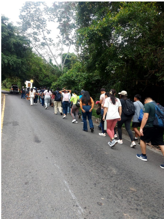
Los peregrinos avanzan por las calles, acompañados por las autoridades que velaron por la jornada.

“Devoción al Gran Arcángel San Miguel, Guerra Espiritual contra el mal, Servicio al Prójimo.”