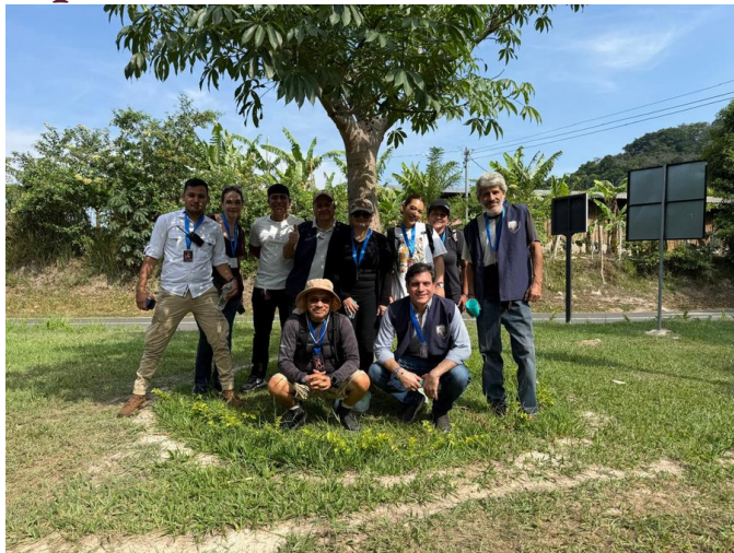
Caballeros, Damas y Voluntarios de la Orden ESMA durante la jornada.

La jornada transcurrió sin ningún percance, gracias al valioso apoyo de las autoridades civiles, militares y policiales.