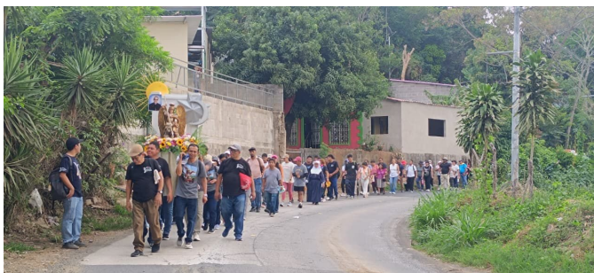
La columna de peregrinos avanza por los caminos rumbo a Huizúcar.

El sábado 9 de mayo de 2026 amaneció bendecido por un cielo claro y sereno, como si Nuestro Señor Jesucristo y la Santísima Virgen María quisieran acompañar con su gracia esta primera gran caminata de fe.