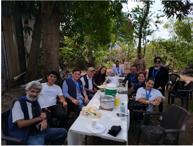
Damas y Caballeros de la Orden en un breve receso después de haber caminado los 10 kilómetros en un ensayo real de la caminata, el domingo 3 de mayo.