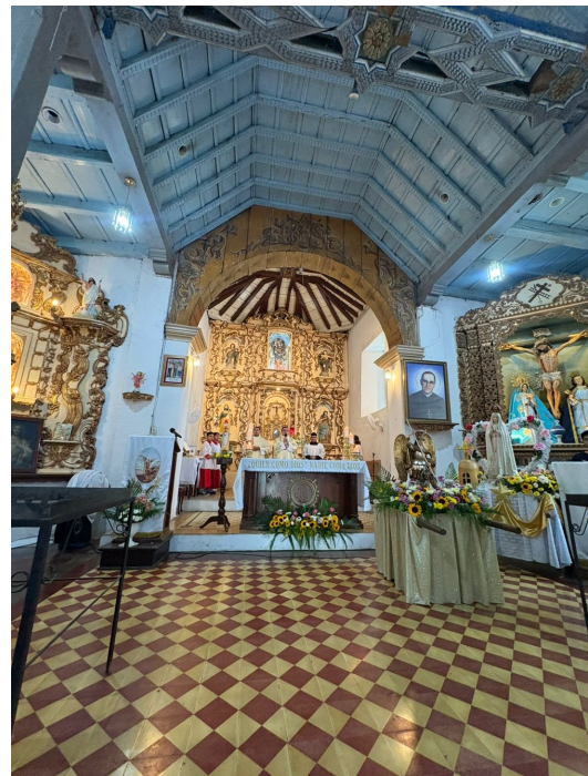
El altar mayor colonial durante la Santa Misa: «¿Quién como Dios? Nadie como Dios».