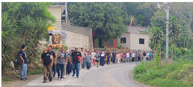
Los peregrinos cargan la imagen de San Miguel Arcángel por los caminos hacia Huizúcar.

Un día después del primer aniversario de la idea fundacional, los fieles devotos unidos en la Orden caminaron espiritualmente hacia el santuario de San Miguel Arcángel en Huizúcar.