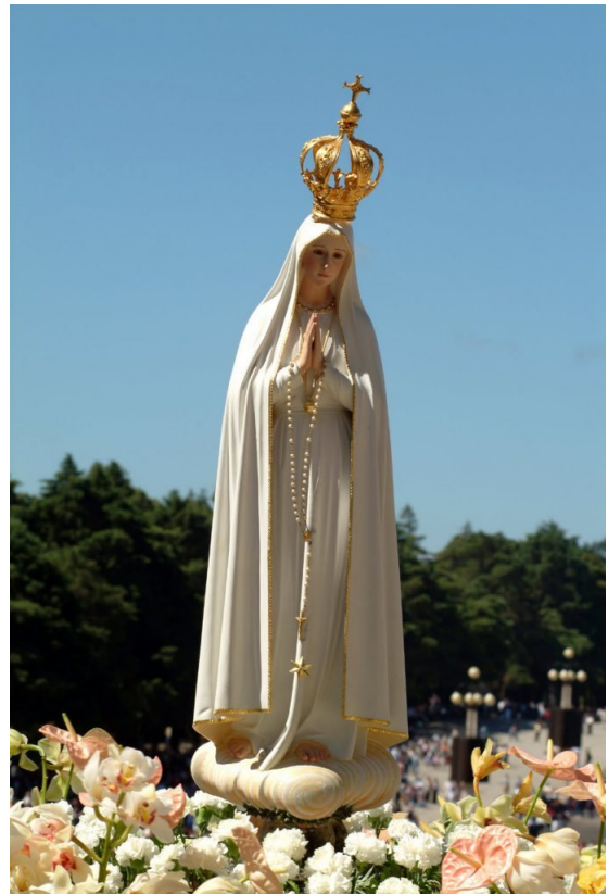
«Hágase en mí según tu palabra»: el modelo del caballero cristiano.

Para nuestra Orden, la devoción mariana no es un añadido: es parte esencial de nuestra identidad. No se puede amar al Arcángel sin amar a aquella a quien él sirve con todo su ser.