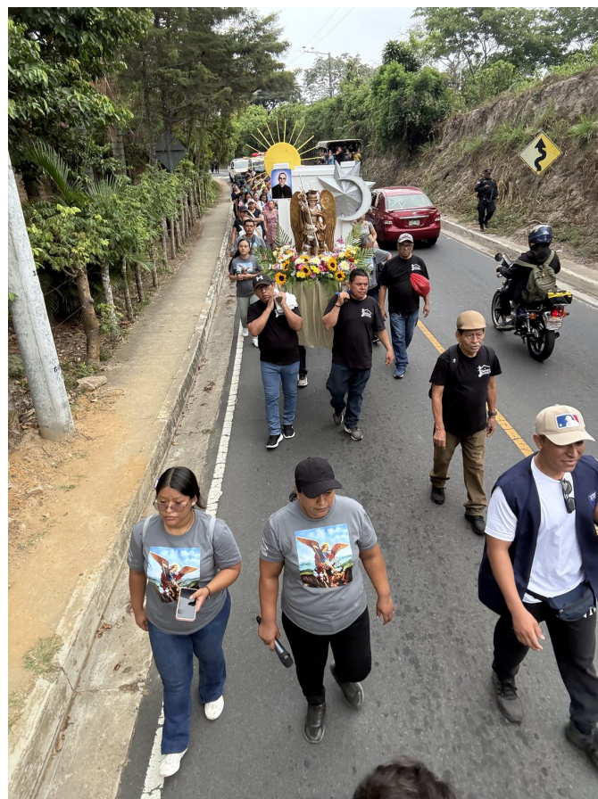
Un momento de la jornada: la fe puesta en camino hacia el santuario.

Esta primera peregrinación queda sembrada como tradición: la Orden aspira a que cada año más fieles se unan a este caminar de fe hacia Huizúcar. A todos los que participaron, organizaron y apoyaron: ¡que San Miguel les recompense su entrega!