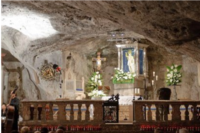
La gruta sagrada de Monte Sant'Angelo (Gargano, Italia), consagrada por el propio Arcángel.

Cada 8 de mayo la Iglesia celebra la Aparición de San Miguel Arcángel en el Monte Gargano (Italia). Según la tradición, alrededor del año 490 el Arcángel se apareció varias veces al obispo Lorenzo Maiorano y al pueblo, indicando que la cueva era sagrada y que él mismo sería su custodio.